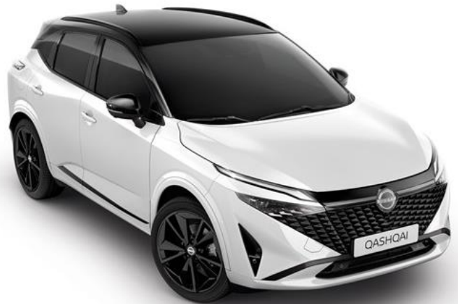
Перлинно-білий + дах чорного кольору - XKJ