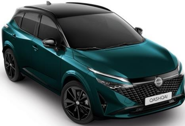
Синьо-зелений преміум + дах чорного кольору - YBJ

Текна: +38 250 грн (включно з вартістю фарби преміум/перламутр) N-Design / Текна+: стандартне обладнання