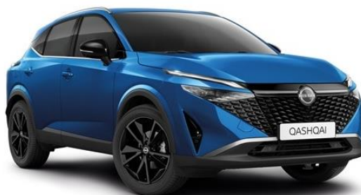
Лазурний перламутр - RCF