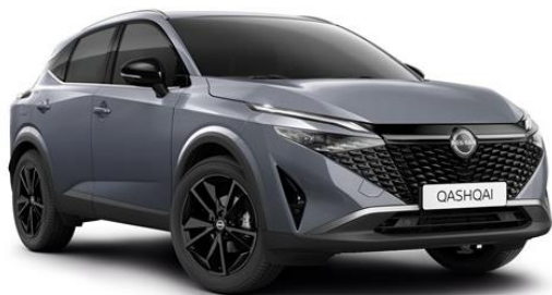
Сірий перламутр - KBY