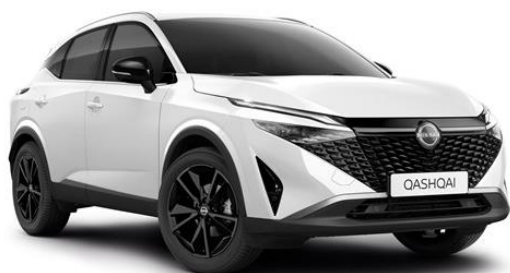
Перлинно-білий - QBE