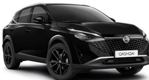
Чорний перламутр - GAT