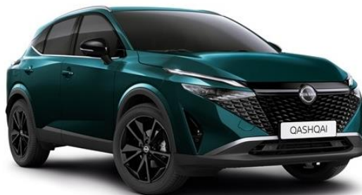
Синьо-зелений преміум - FAP