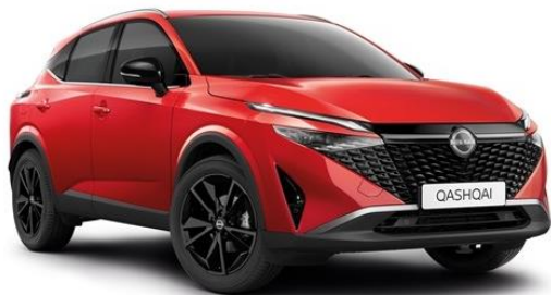
Червоний Fuji Sunset - NBV