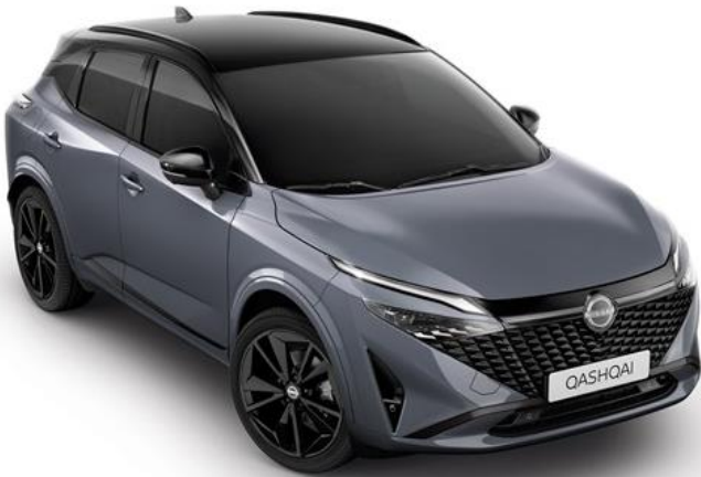
Сірий перламутр + дах чорного кольору - XEX