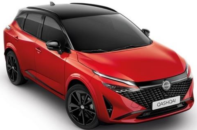
Червоний Fuji Sunset + дах чорного кольору - YAU