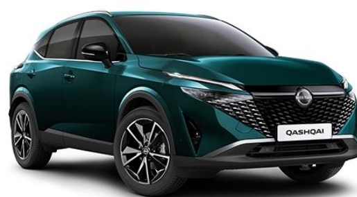
Синьо-зелений преміум – FAP