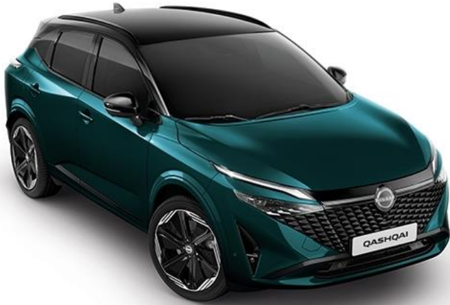
Синьо-зелений преміум + дах чорного кольору - YBJ

Текна: +38 140 грн (включно з вартістю фарби преміум/перламутр) N-Design / Текна+ : стандартне обладнання