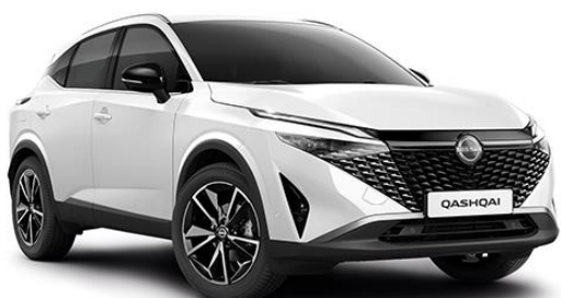
Перлинно-білий – QBE