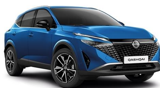
Лазурний перламутр – RCF