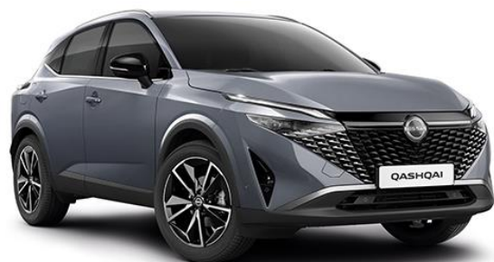
Сірий перламутр – KBV