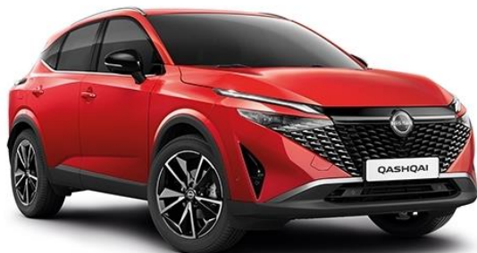
Червоний Fuji Sunset – NBV