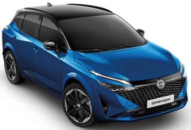
Лазурний перламутр + дах чорного кольору - XGZ