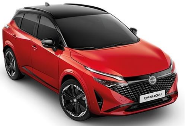
Червоний Fuji Sunset + дах чорного кольору - YAU