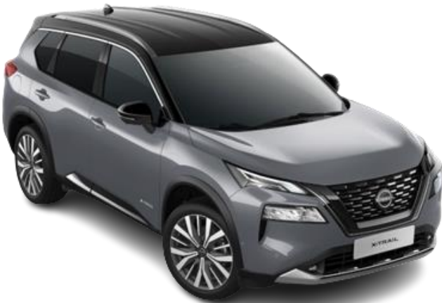
Сірий перламутр з чорним дахом – XEX

Двоколірний кузов (основний колір – преміум/перламутр): +39 740 грн (включно з вартістю фарби преміум/перламутр)