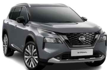
Сірий перламутр - KBV