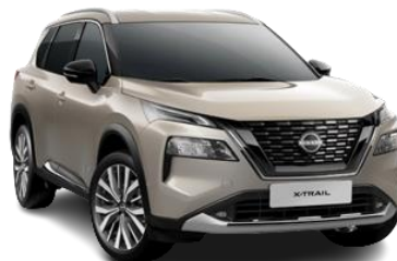
Срібло шампань - KAY