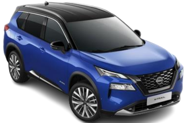
Синій металік з чорним дахом – XEU

Двоколірний кузов (основний колір – преміум/перламутр): +39 740 грн (включно з вартістю фарби преміум/перламутр)