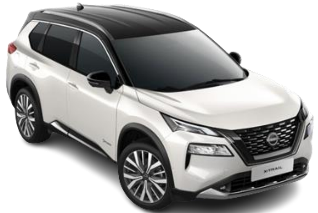
Білий перламутр з чорним дахом – XKJ