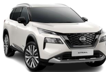
Білий перламутр - QBE