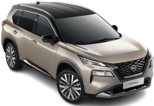
Срібло шампань з чорним дахом – XEW

Двоколірний кузов (основний колір – металік): +30 180 грн